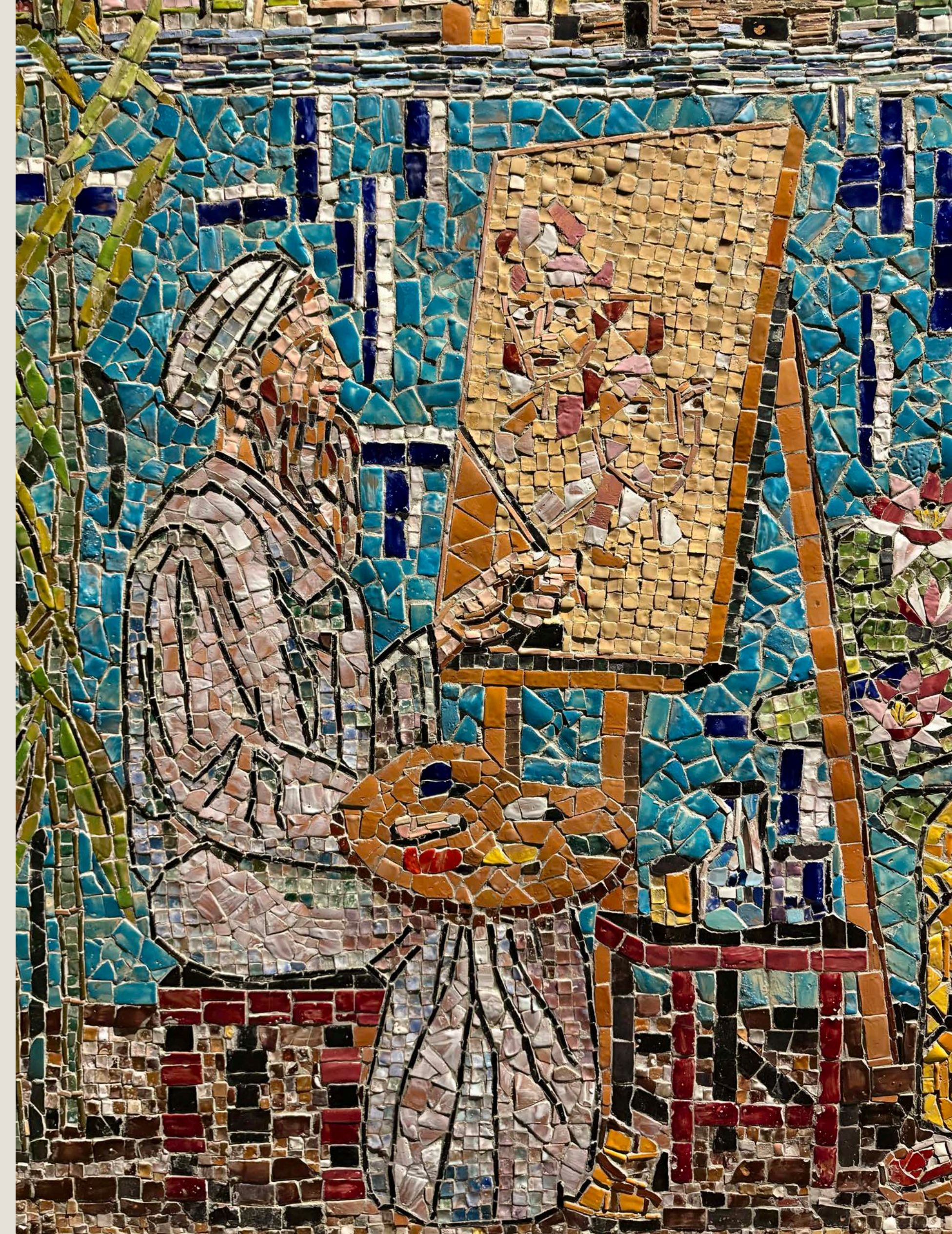
Mosaik-Kunstwerk in Blevio.

Ein Highlight ist die Bootsfahrt von Cernobbio nach Blevio, einem Künstlerdorf auf der gegenüberliegenden Seeseite. Bei einem Rundgang entdecken wir Mosaik-Kunstwerke der dort lebenden Künstler und besuchen ausgewählte Ateliers. Anschließend halten wir unsere Eindrücke bei italienischen Köstlichkeiten schriftlich oder gestaltend fest. Ein Halbtagesausflug führt uns nach Como. Beim Schlendern durch die Altstadt und Besuch des Doms lassen wir uns von der faszinierenden Stadt inspirieren und bringen diese Eindrücke kreativ zu Papier.